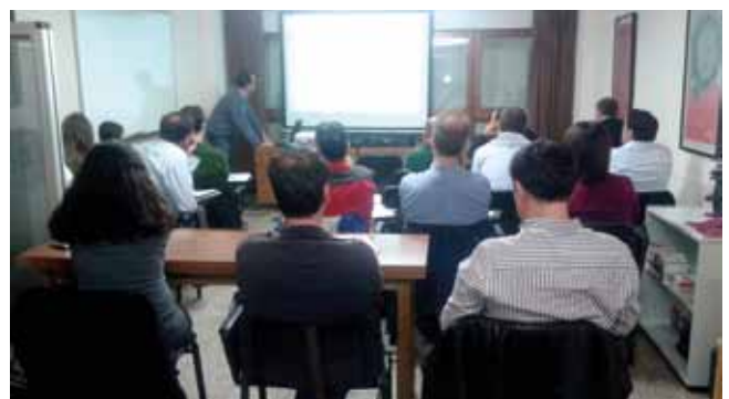
Els dos cursos van obtenir una gran resposta per part dels nostres col·legiats.

Els dies 14 i 21 de maig del 2015, i també fruit de la col·