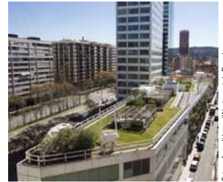
Model de coberta verda