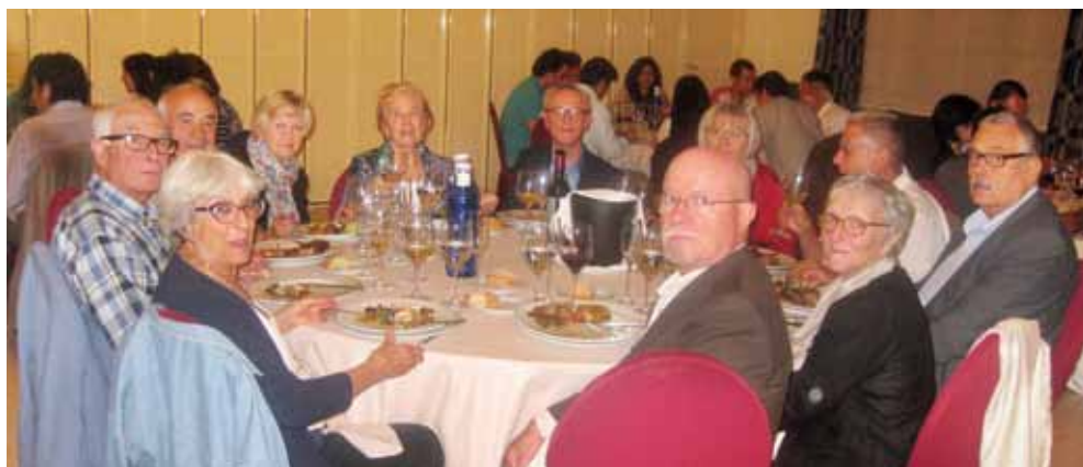
Celebrant sant Isidre al restaurant Mas d'en Ros.

Aquest any s'ha realitzat al restaurant Mas d'en Ros, proper a Reus, amb l'assistència de 42 col·legiats i de les seves parelles. Com és habitual en aquets actes, la convivència, el bon humor i els comentaris sobre l'actualitat i retrospectius van ser les notes dominants.