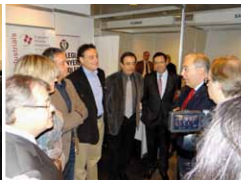
A la Fira del Treball organitzada per la UdL.