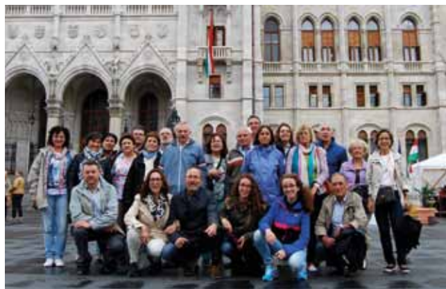
Els col·legiats que van viatjar a Budapest.

Dins d'aquest marc, 24 col·legiats de la Demarcació de Lleida van viure uns dies de diversió i coneixença d'un país ple de contrastos, amb una rica cultura i una bona gastronomia, un viatge ple de descobriments que va estrènyer llaços entre el grup de companys/es.