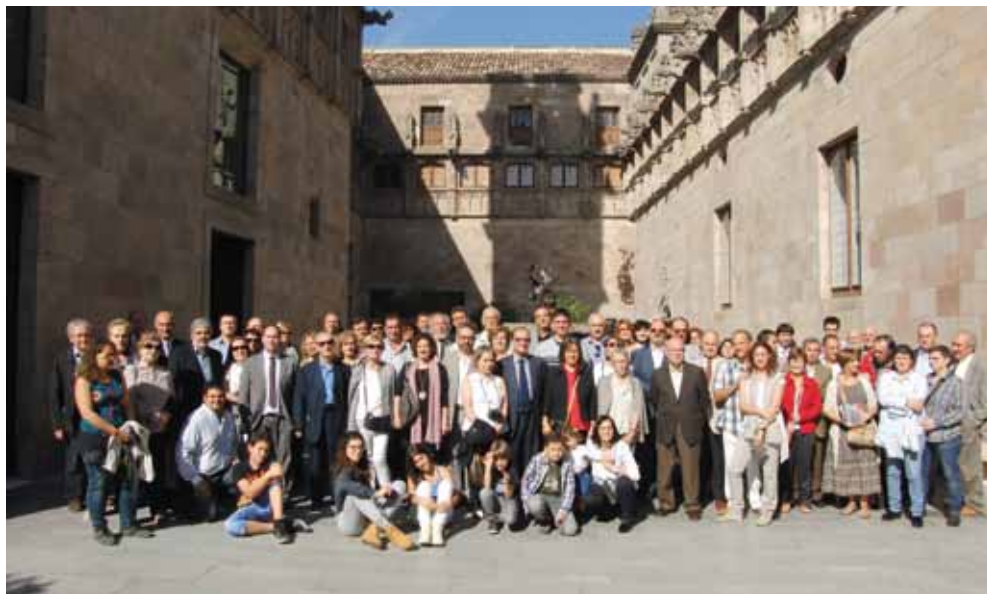
Foto de grup al Palau de la Generalitat.

Al matí tots els assistents van poder gaudir d'una visita guiada a l'Ajuntament de Barcelona i al Palau de la Generalitat de Catalunya.