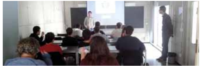
Visita de la demarcació als estudiants de final de carrera.

La Taula de l'Enginyeria de les Comarques Gironines (TEG) és una entitat de la qual la demarcació de Girona n'és membre i integra els