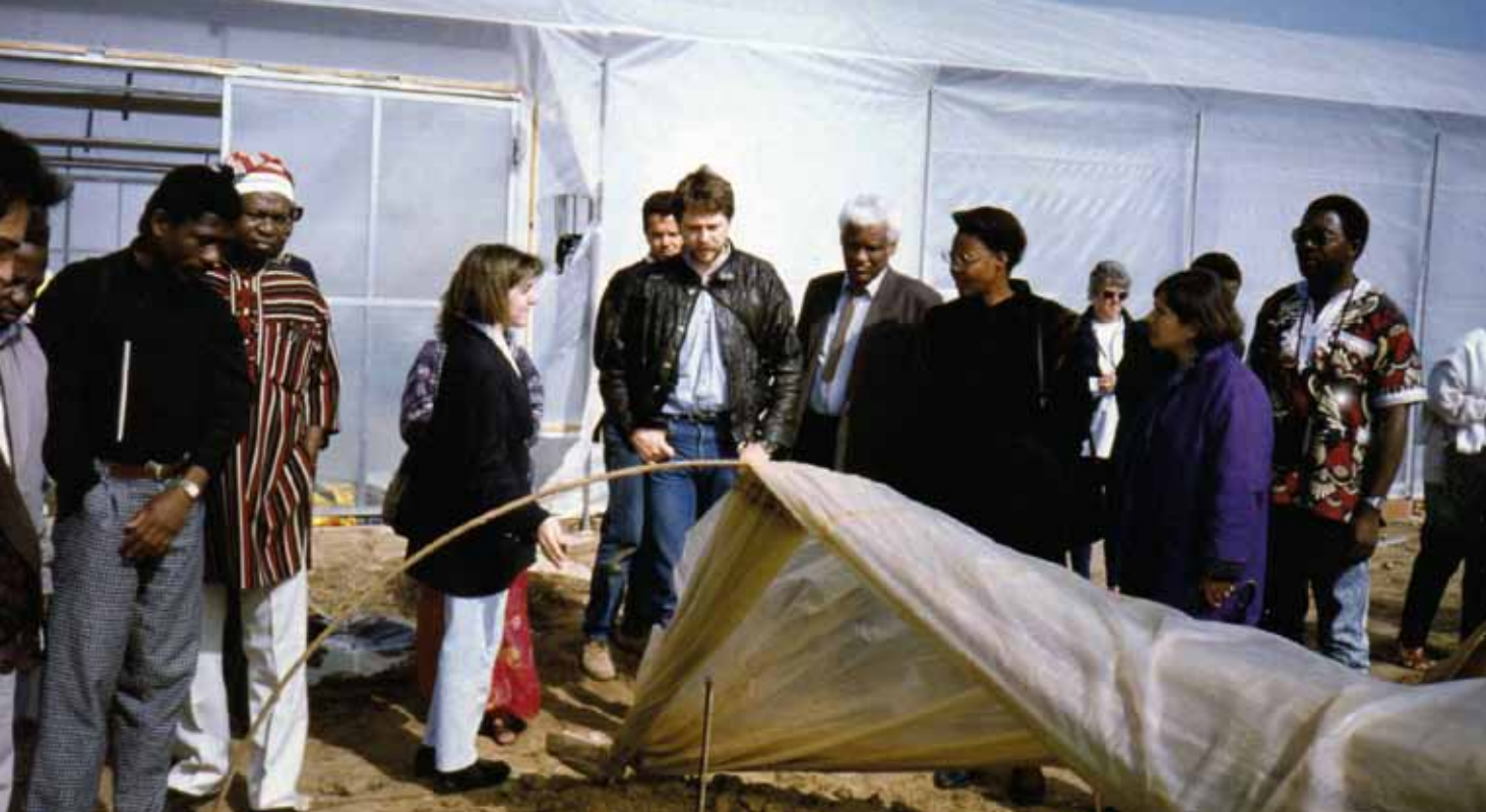
La formació d'agents locals és fonamental per no caure en el paternalisme.

Actuacions estables a mig i llarg termini. Són les que despleguen les ONG, i més concretament les qualificades de desenvolupament (ONGD). Treballen en regions que presenten unes garanties d'estabilitat per mantenir una continuïtat en els programes i garantir la seguretat del seu personal. Els programes s'implementen en funció dels problemes detectats, cercant la idoneïtat pràctica dels projectes i les actuacions, utilitzant els mitjans endògens –materials, humans i econòmics– i emprant l'esforç dels cooperants per tirar endavant les tasques de camp.