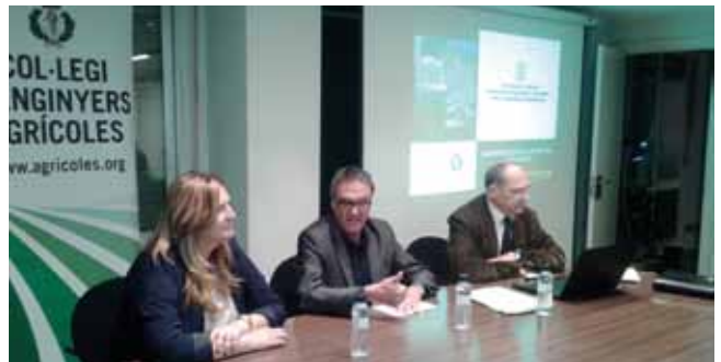
Un moment de les jornades de formació.

Aquestes jornades van ser organitzades pel nostre Col·legi conjuntament amb