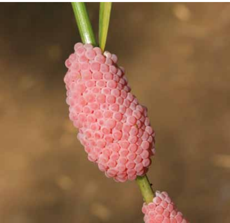
El cargol poma adult pot arribar a fer 15 cm.