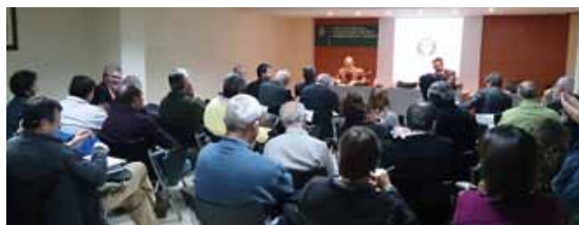
Un moment de les assemblees celebrades el 28 d'abril.

Durant l'Assemblea Ordinària es van aprovar la Memòria d'activitats del COETAPAC del 2014,