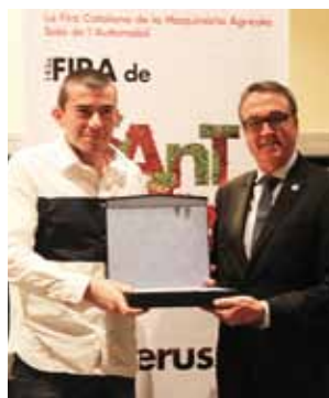
L'entrega del Premi d'Innovació en Maquinària.

La nostra participació va tenir lloc en el marc de la CPA, compartint estand amb altres col·legis professionals de la demarcació. La fira va adreçada a titulats recents i a alumnes dels darrers cursos per tal d'oferir-los orientació i assessorament en la incorporació al mercat laboral.