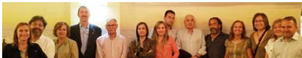
Imatge dels assistents al sopar de sant Isidre 2015, que es va celebrar al Restaurant Lakinoa de Tortosa.

El divendres dia 29 de maig es va celebrar el tradicional sopar de germanor de la festivitat de sant Isidre, que va tenir lloc al Restaurant Lakinoa de Tortosa.