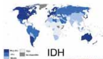
Mapa de països segons l'IDH

Diferents organismes, fundacions i ens a nivell mundial, a més d'una plèiade d'entitats privades –principalment les ONG–, despleguen programes d'ajuda. Entre les primeres