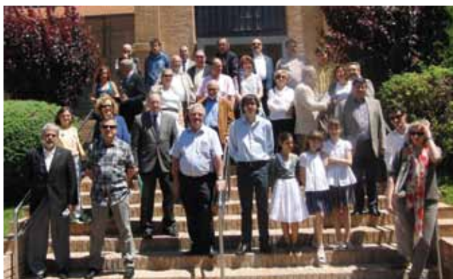
El grup, a la sortida del museu.