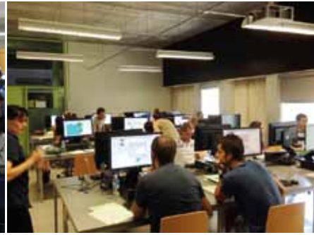
Instantània de la Jornada de SIGPAC.