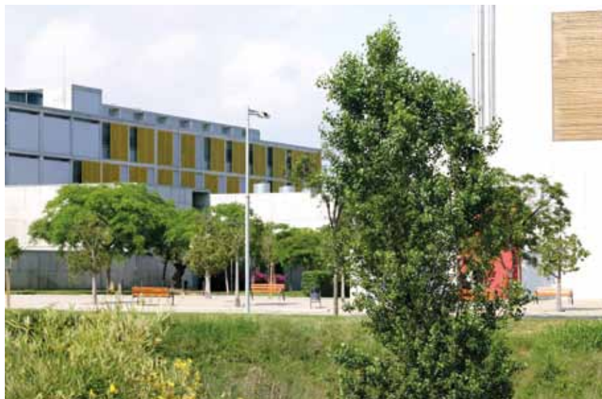
Els estudis superiors no poden perdre la seva competitivitat.

Aquesta decisió condemna a la pèrdua de competitivitat i de reconeixement a tots aquells professionals que han realitzat estudis Màster d'Universitats espanyoles com a titulació pròpia, o fins i tot aquells programes de postgrau que ni es definien com a oficials ni com a titulació pròpia, però emparats per la universitat.