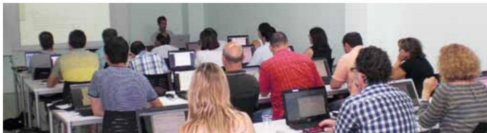
Un moment de la formació.

Curs de Certificació Energètica d'Edificis: Adreçat als col·legiats interessats en aprendre a fer certificacions energètiques d'edificis amb els programes CE3 i CE3X, es va realitzar els dies 19 i 21 de gener del 2015.