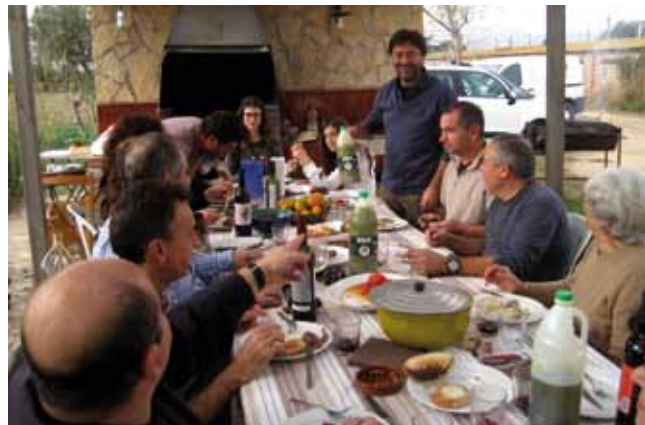
Tast d'olis de la nova collita.